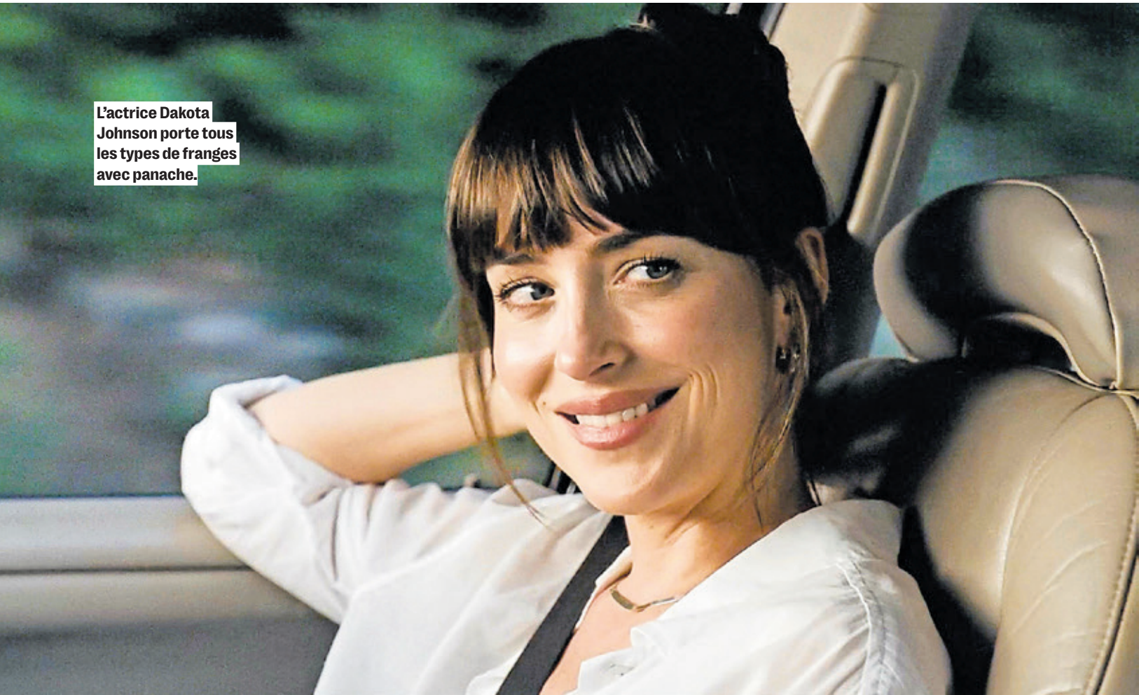
L'actrice Dakota Johnson porte tous les types de franges avec panache.