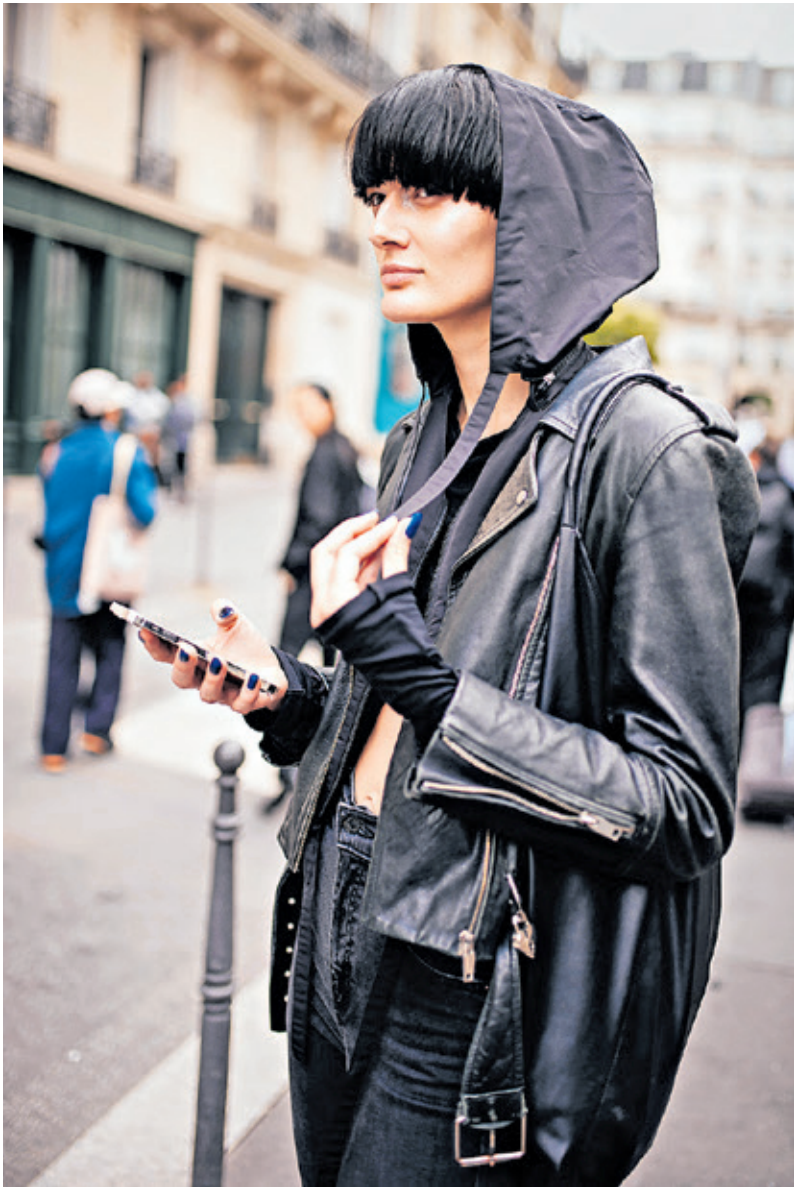
Presque toutes les franges conviennent à une forme de visage ovale. Celle-ci, pleine, attire tous les regards.

Pour Mademoiselle M, une frange rideau, popularisée dans les années 1970, adoucit les angles d'un visage carré en l'encadrant. Elle invite à privilégier une frange effilée sur un visage rond, de manière à lui amener de la longueur. D'autres suggestions à découvrir ci-dessous, grâce aux conseils de la → Page 79